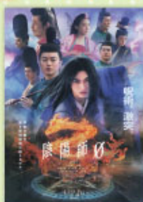
陰陽師0 4月19日(金)公開