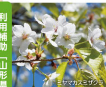
ミヤマカスミザクラ