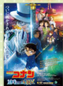
名探偵コナン 100万ドルの五稜星 4月12日(金)公開