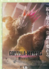
ゴジラ×キング 新たなる帝国 4月26日(金)公開

※諸般の事情により、公開が延期されることがあります。詳しくはMOVIE ON やまがたまでお問い合わせ下さい。