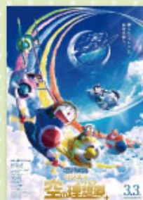
映画ドラえもん のび太と空の竜