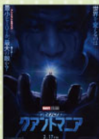
アントマン&ワスプ クアントマニア