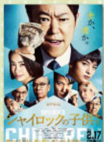
シャーロックの子供たち