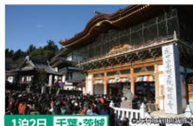
1泊2日 千葉県・茨城県