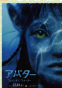
アバター ウェイ・オブ・ウォーター

※上映の準備により、公開が延期されることがあります。詳しくはMOVIE ON やまがたまでお問い合わせ下さい。