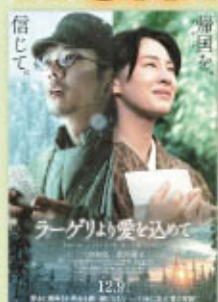
ラゲリより愛を込めて